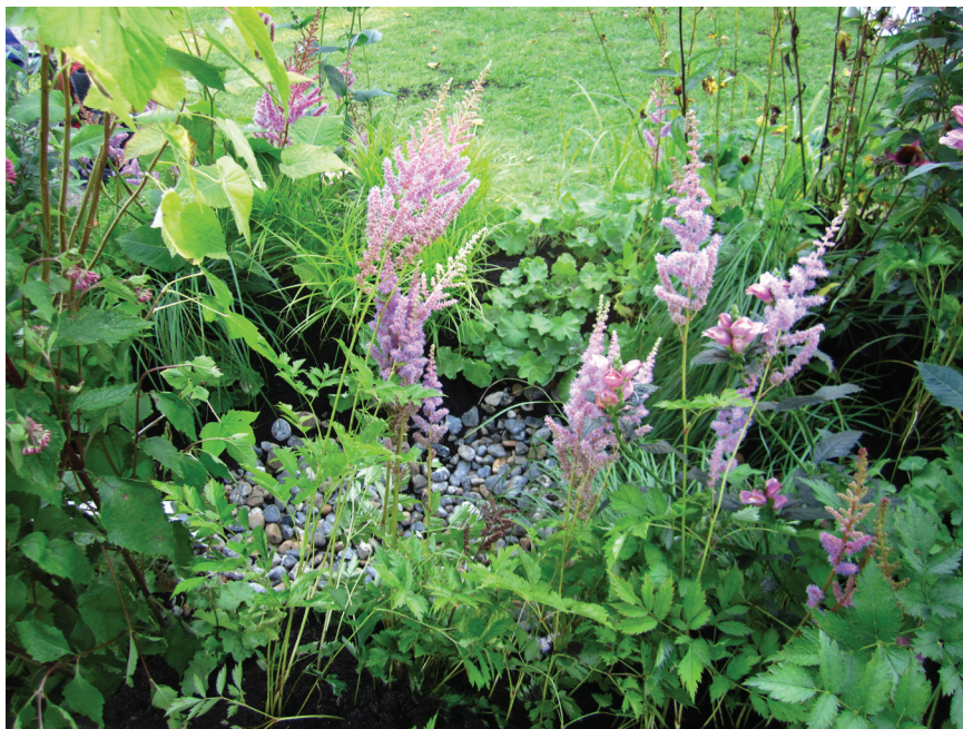
Det er vigtigt at plante tæt for at opnå et frodigt udtryk i regnbedet.

Du sikrer bedets frodighed bedst ved ikke at plante i for store grupper, men blande planterne mellem hinanden, som man også ser det i naturen.