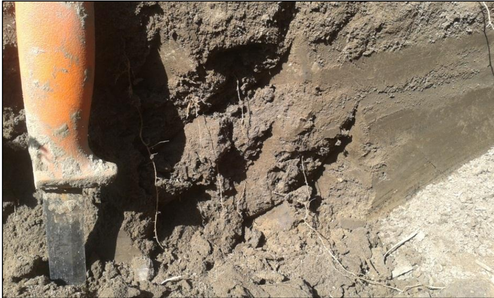
Figure 6: Udtværet "smearet" overflade af ler samt eksponeret overflade brækket fri med kniven.

For at sikre sig repræsentative målinger anbefales det altid at lave triplets af alle infiltrationsforsøg, D.V.S. gentage forsøgene 3 gange, idet forholdene kan være lokalt påvirket f.eks af "traktose" hvor et tungt køretøj har kompakteret jorden. Derved reduceres nedsivningsevnen i jorden kraftigt og alle målinger her er behæftet med stor usikkerhed.