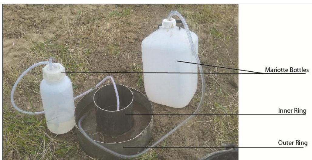
Figure 1: Main components of a Double Ring Infiltrometer (falling head method)

An excel sheet on how to calculate K_{sat} under falling head conditions is available under: http://www.soilmoisture.com/operating.html