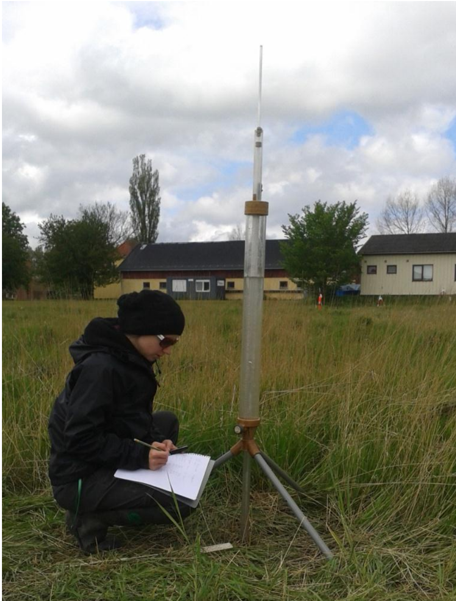
Figure 5. Guelph permeameteret i action. Igen noteres vandforbruget efter faste tidsintervaller.