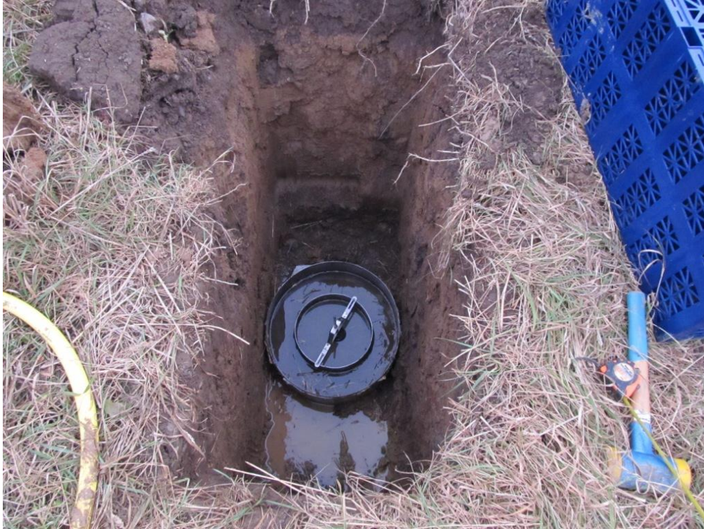
Figur 3. Ring infiltrometret kan også bruges i udgravninger for at måle præcis nedsivningskapacitet i forskellig dybde, f.eks. i normal faskinedybde. Det skal bemærkes at i modsætning til faskiner der dræner ud igennem væggene, vil dobbelt ringifiltrometret kun måle udsivning igennem bunden af udgravningen.