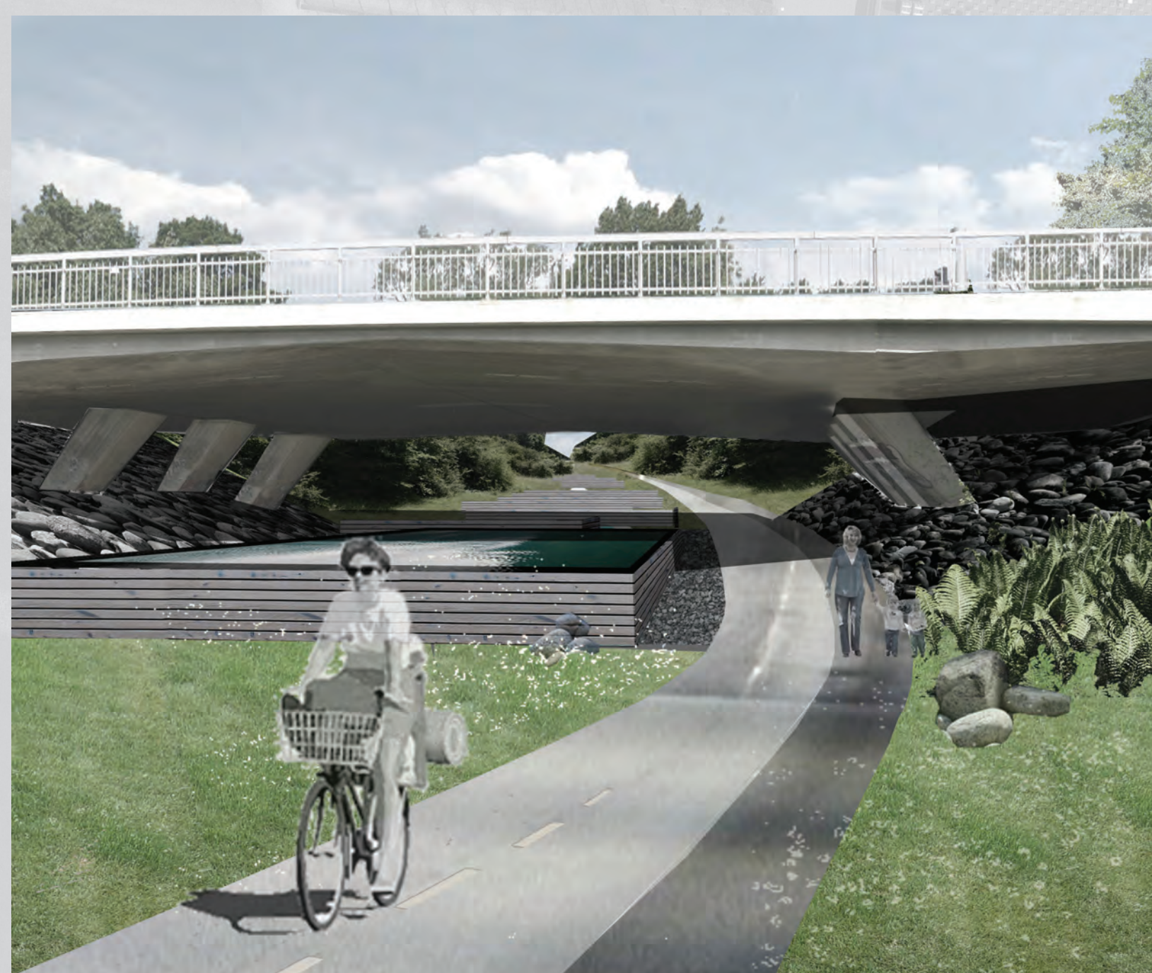
Visualisering af Kaskaderne under Gladsaxevej.

Vi er i fuld gang med at anlægge Vandledningsstien og regnvandslandskabet. Stien er klar til brug i september 2013. Projektet gennemføres i samarbejde med Gladsaxe Kommune.